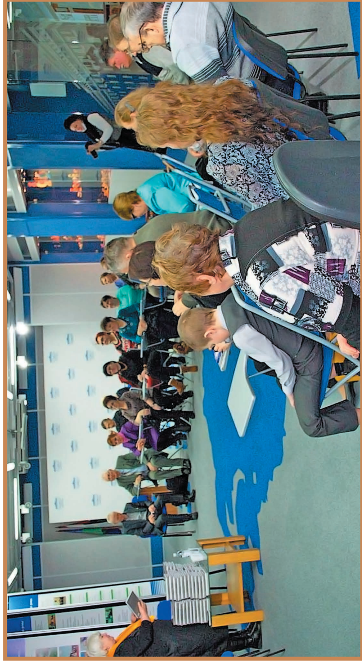
16 декабря 2016 г. Тюмень. Областная Дума. В рамках проекта «Открытая Дума» прошла презентация литературно-поэтического альманаха «Поэзия земли Тюменской» №18.