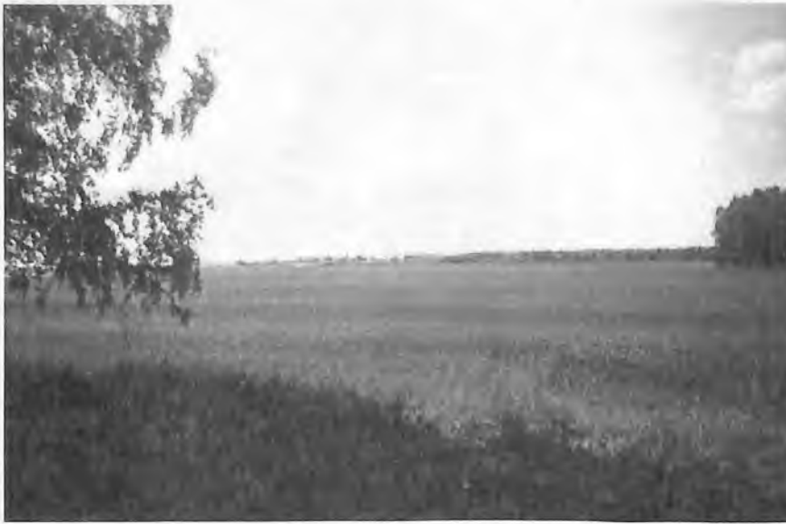
Лето в родном краю