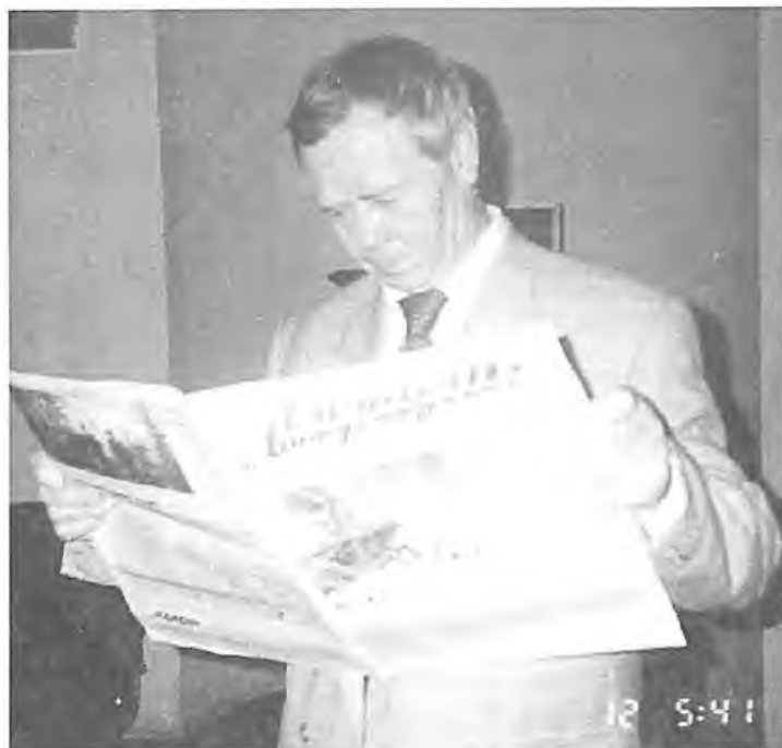
Валентин Григорьевич Распутин