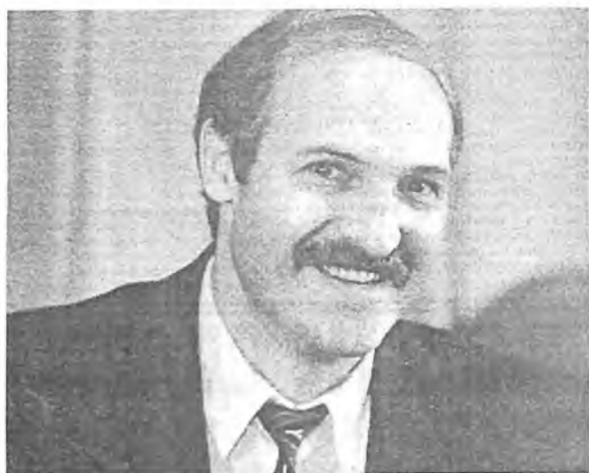
Александр Григорьевич Лукашенко