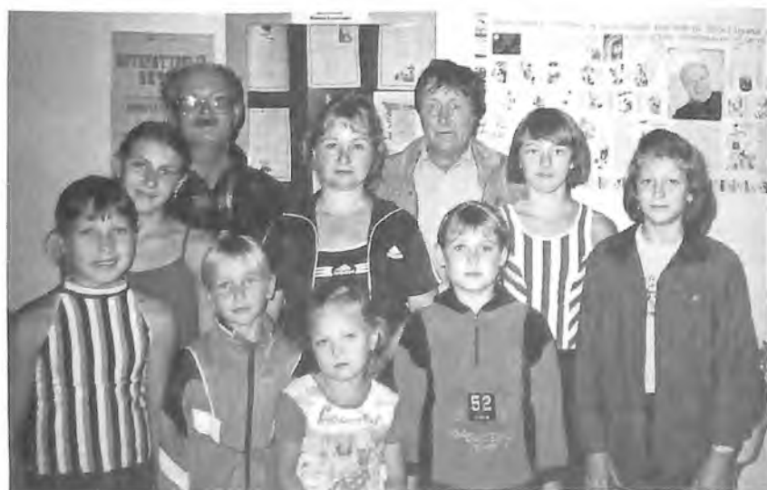
Активисты первого в Тюменской области Литературного музея в с. Окунёво Бердюжского р-на