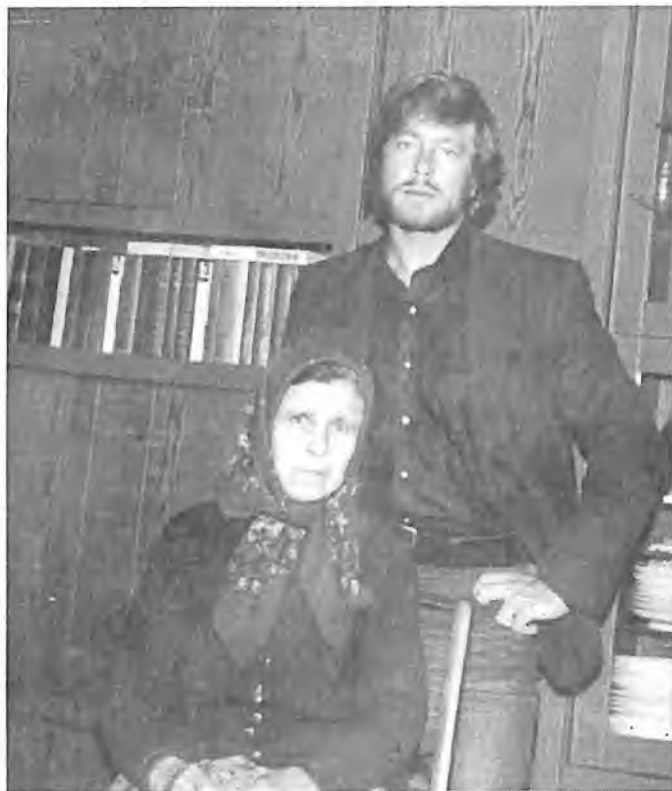
На фото: мама и я