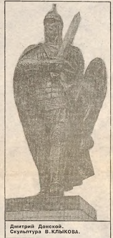
Дмитрий Донской. Скульптура В.КЛЫКОВА.

Гитлер, став диктатором Германии, подмял под себя Европу и возомнил, что способен стать диктатором Мира. Просчитался ефрейтор-австрияк. Ему не простили высокомерного самомнения и толкнули под пушки СССР, тем самым "убивая двух зайцев" - наказывая строптивого фюрера и ослабляя СССР. Гитлер погиб, повторив судьбу другого строптивца - Ленина.