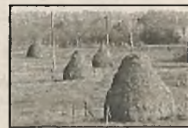
"Дохнул осенний хлад..."