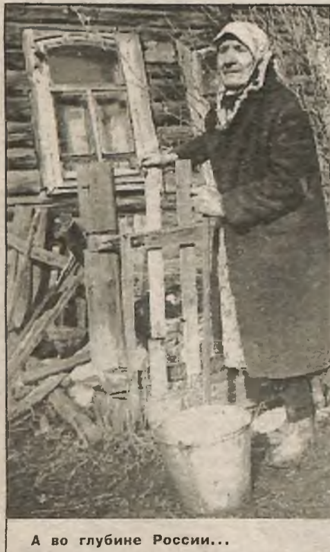
А во глубине России...

Самое гениальное - это то, что уничтожившие Сталина "красные" масоны (в соответствии с позволенной им на нижнем уровне масонской пирамиды демократией) вдохновляют славян на борьбу за возврат к "обновленному, еще