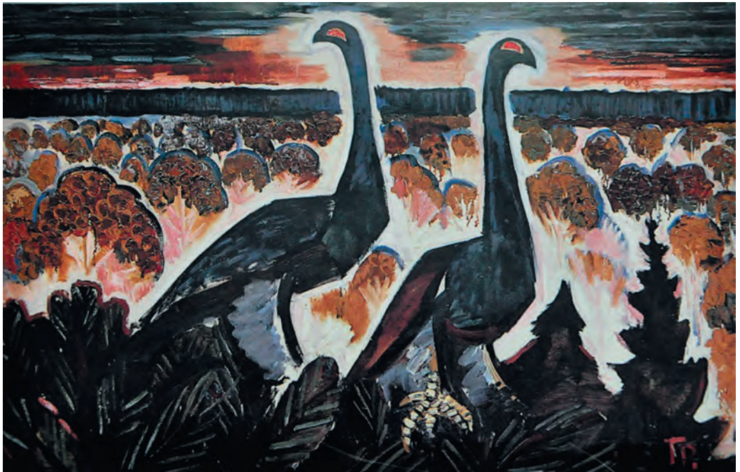
«Глухари», 1967 г.