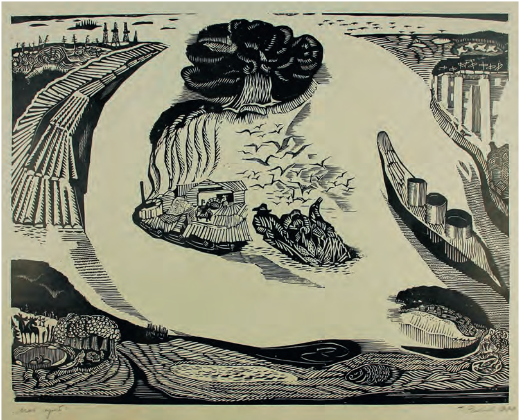
«Мой край», 1970 г.