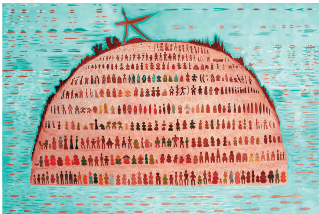
«Югорская легенда», 1986 г.