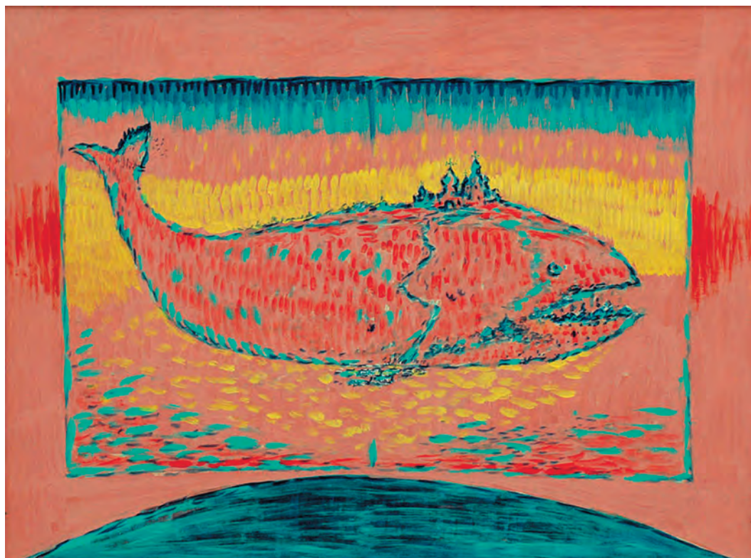
«Чудо-юдо Рыба-кит». Серия иллюстраций к сказке П.П. Ершова «Конек-Горбунок», 2006 г.