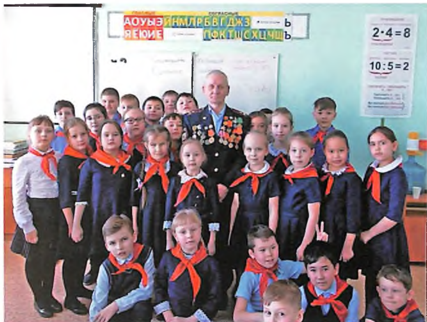
22.02.2019 г. Ярково. СОШ. 3 «Б» класс — класс пионеров школы — один из победителей смотра песен среди младших классов.