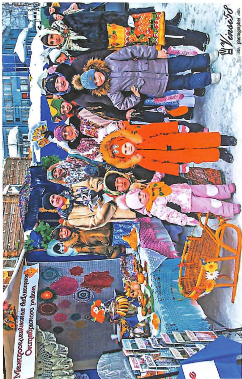
08.03.2019 г., гп. Октябрьское. ХМАО-Югра. Отмечаем Международный женский день.