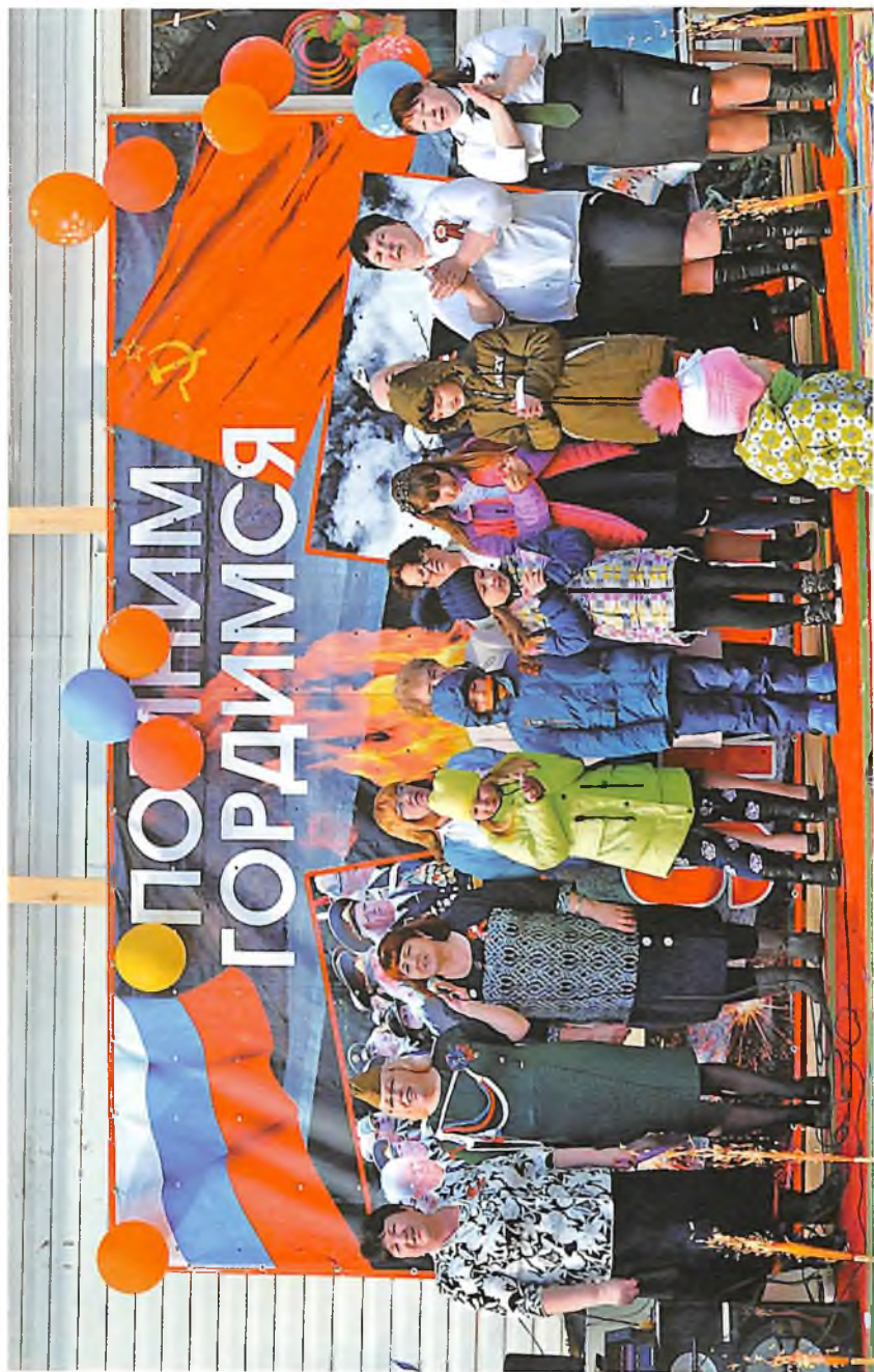
08.05.2018 г. Большие Леуши. Октябрьский район. ХМАО-Югра. Песня теплого майского дня.