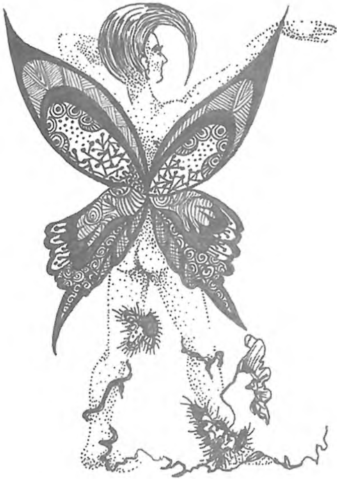
Бабочка, апрель 2001г. Елена Савенок