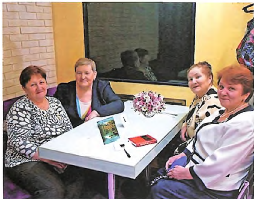
Наш 28-ой выпуск альманаха.