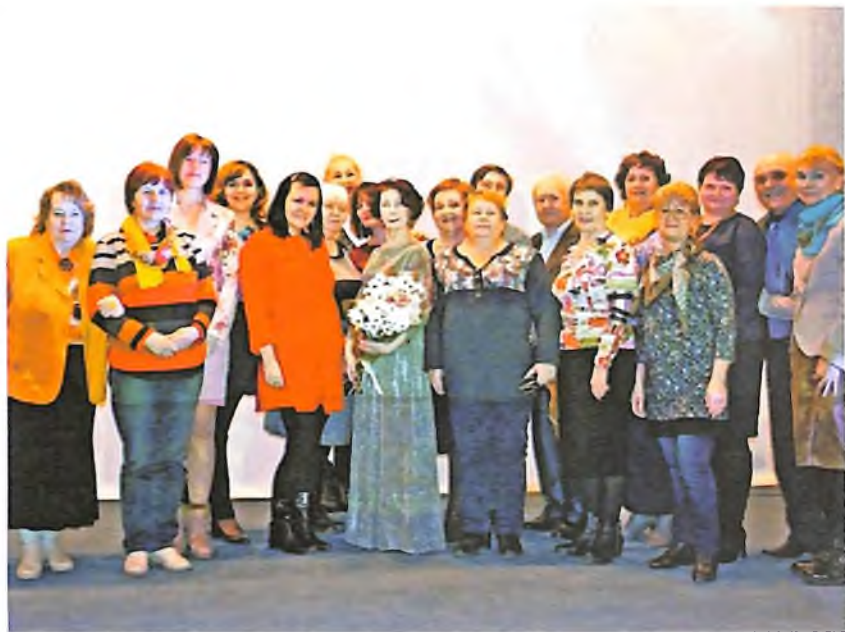
23.03.2019 г., г. Тюмень. ОДНК «Строитель». Праздничная программа «В гостях у Надежды», посвящённая Всемирному Дню поэзии и десятилетию со дня образования нашей Ассоциации.