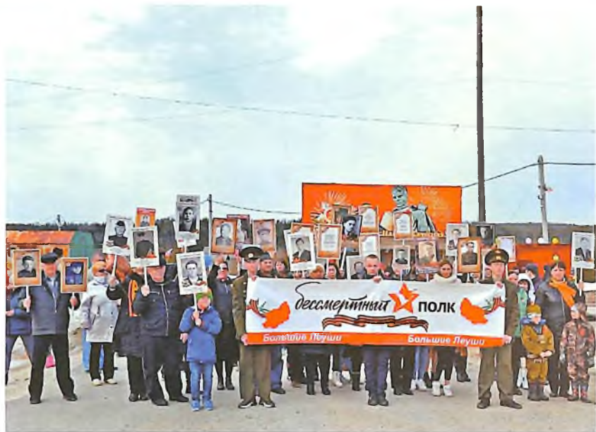
09.05.2019 г. Большие Луши. Октябрьский район. ХМАО-Югра.