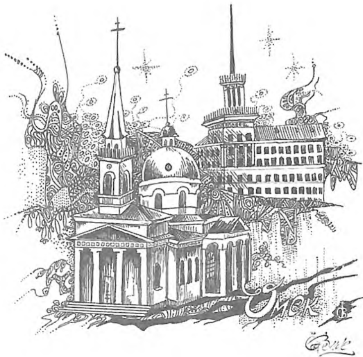
На Омских улицах, июнь 2003г. Елена Савенок