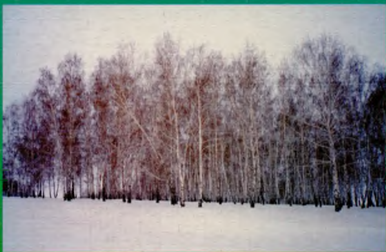
▼ Березовый колок в Бердюжской лесостепи зимой