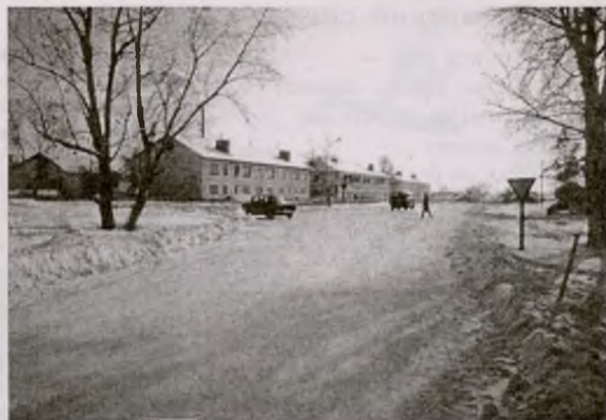
На улице райцентра — зимой

— А что ожидает наше жилищно-коммунальное хозяйство? Эта сфера — одна из самых неблагополучных.