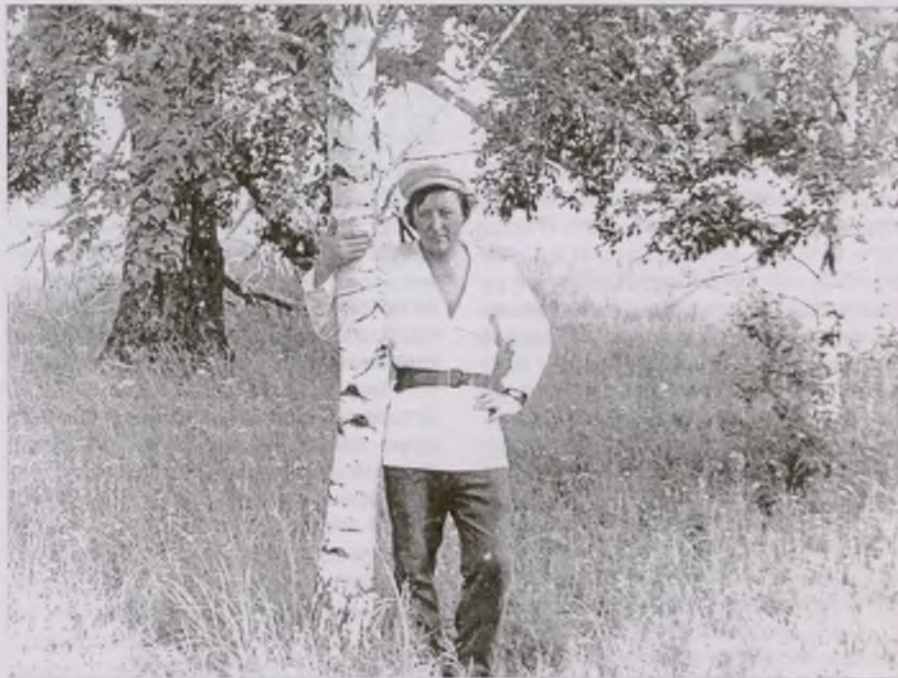
На покосе у Красулева болота

Со сбитыми куполами, с порушенными крестами, с выпотрошенным внутренним, служил он до войны зернохранилищем. После Победы стал нашим клубом. И мне видится одно из первых празднеств в нем — елка! — в каком-то зябком, близком от войны, году.