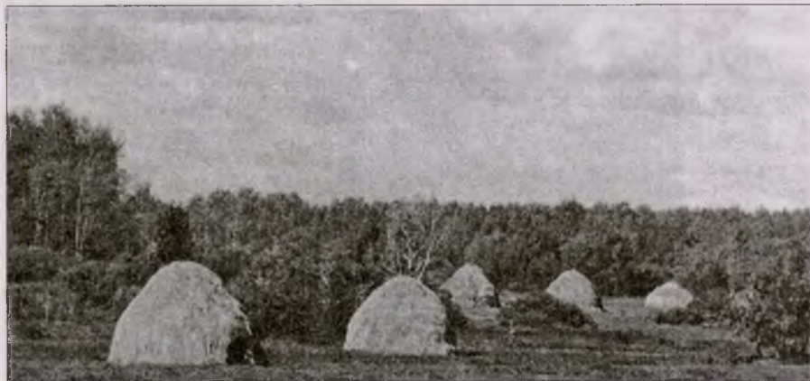
В конце сенокоса

О светло светлая и красно украшенная земля Русская!..