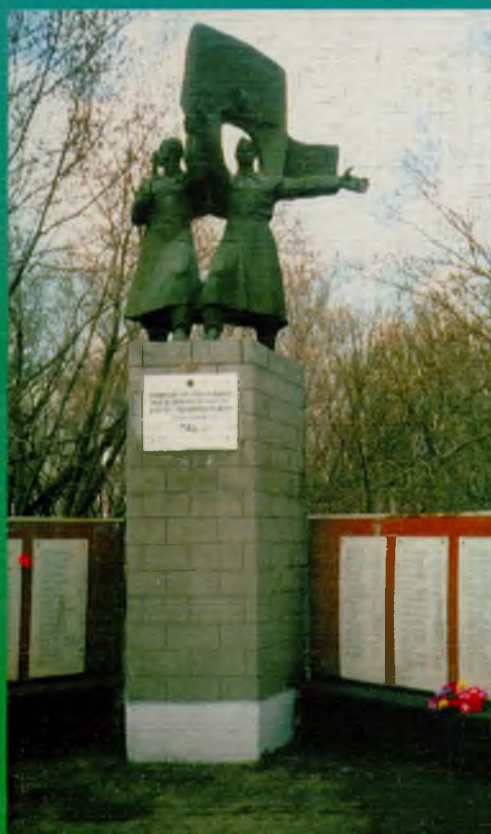
Памятник не вернувшимся с войны в с. Бердюжье