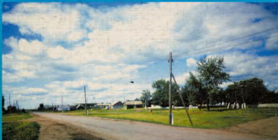
Улица Ленина в селе Окунево ▲