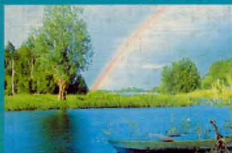
Радуга над озером