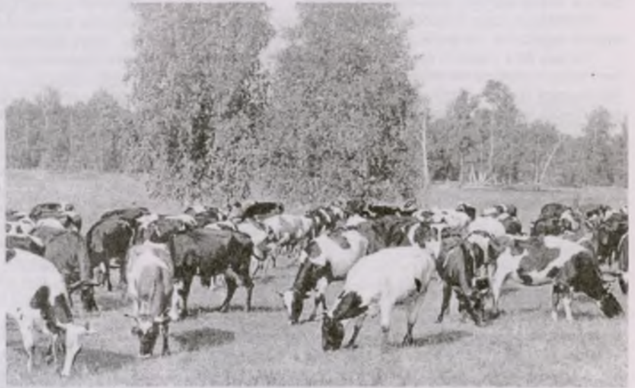
Привычные картины еще недалеких лет в родных сибирских палестинах

условиях были бы не в состоянии ее приобрести.