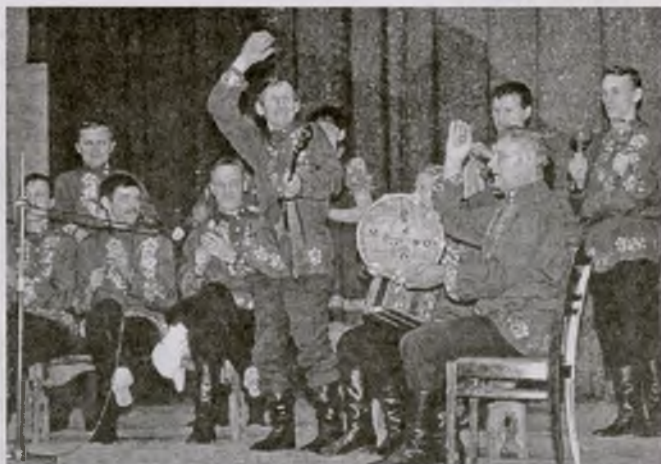
Участники самодеятельности РОВД