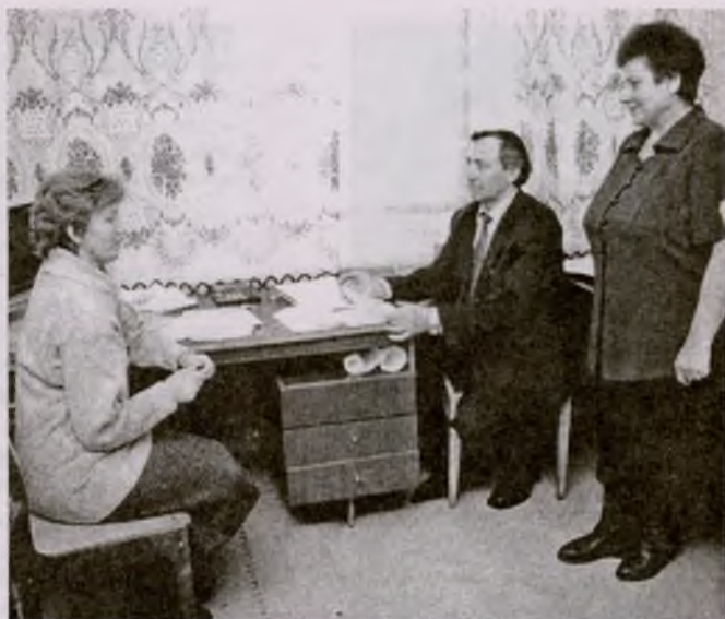
Производственный разговор с сотрудниками агрофирмы