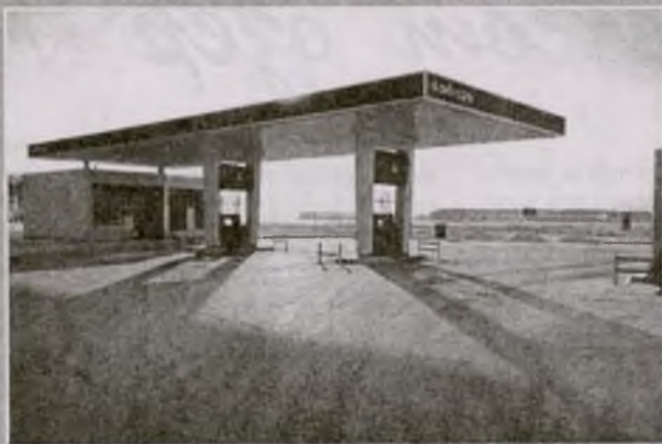
АЗС — на окраине райцентра