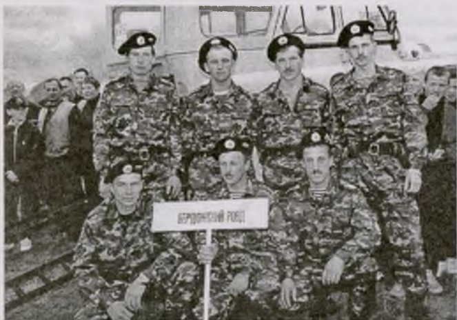
Победители областного конкурса

Сотрудники ОВД принимают активное участие во всех спортивных мероприятиях, проводимых в районе. Коллектив участников художественной самодеятельности ОВД является постоянным финалистом областных конкурсов среди ОВД области.