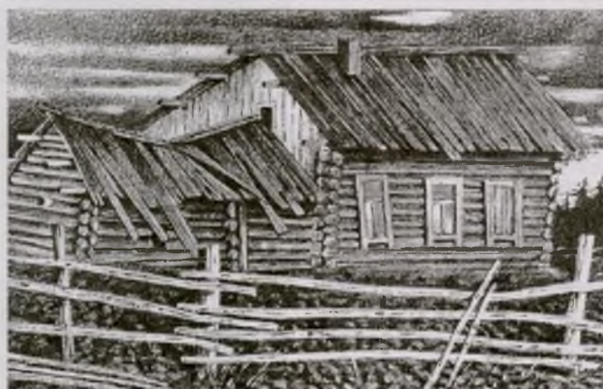
В дальней сибирской деревне

Газета «Новая жизнь», № 26 (9133). Перепечатано в сокращении.