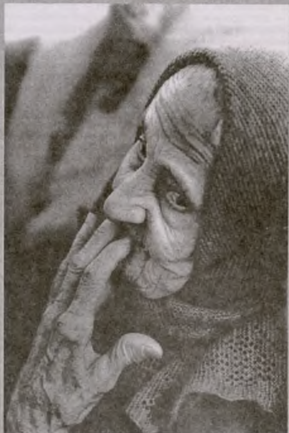
Столько пройдено, пережито...