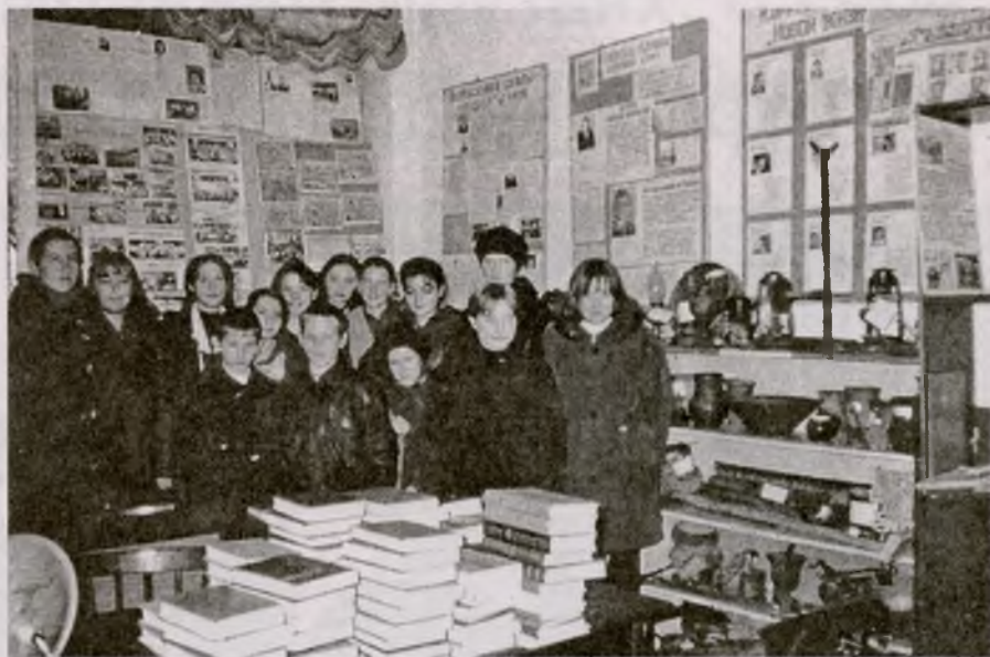
Активисты школьного музея

Вернулся и приступил к работе. И вот 2 марта в школу явился вооруженный человек и предьявил: молодой учитель арестован. Под конвоем я был доставлен в сельревком и там узнал: началось кулацкое восстание. Мытарства по различным деревням, в холодных поме-