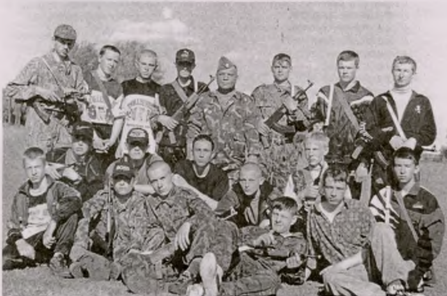
Группа участников военно-полевых занятий школ Бердюжского района, 2002 г.