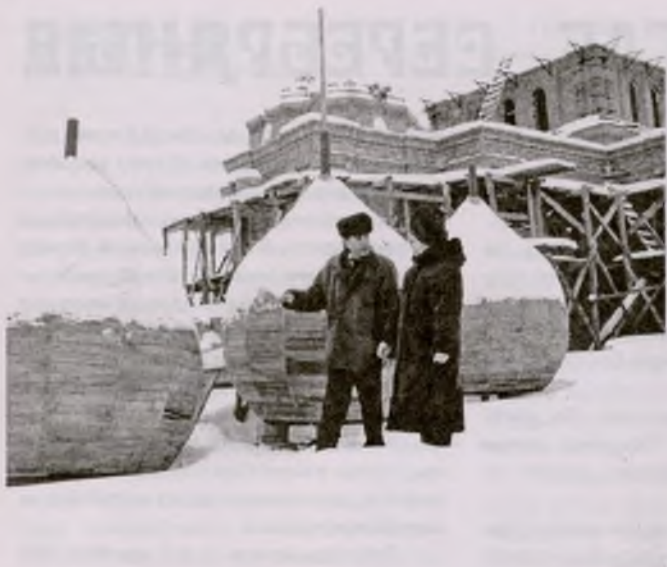
Идут работы по восстановлению православной церкви в д. Кулаково. Привезли будущие купола