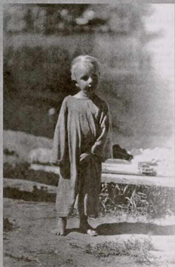
Детство. Все еще впереди...

«Приезжай хоронить...» Приезжал. И белел солонец, И скудел чернозем, И ветшали калитки оград. И еще я приехал, как умер отец. Золотел на селе листопад. Были в золоте крыши, Ступеньки крыльца И вершины стогов на лугу. «Ну так что ж! — я услышал, — Заменишь отца?..» Я ответил: «Уже не смогу...» Да, конечно, ответ мой Не стоил гроша, Невеселые вышли дела. Слишком долго она отвыкала, душа, От обиденной жизни села. Слишком многие дали открыл мне простор, Слишком ярко пылала заря — Над Крутинским увалом, Над хмурью озер, Над короткой красой сентября.