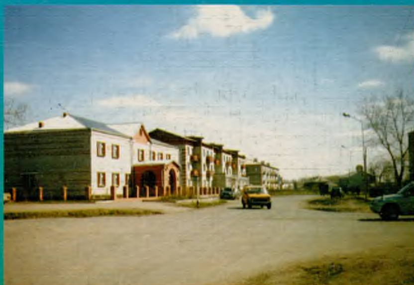
На улице районного центра