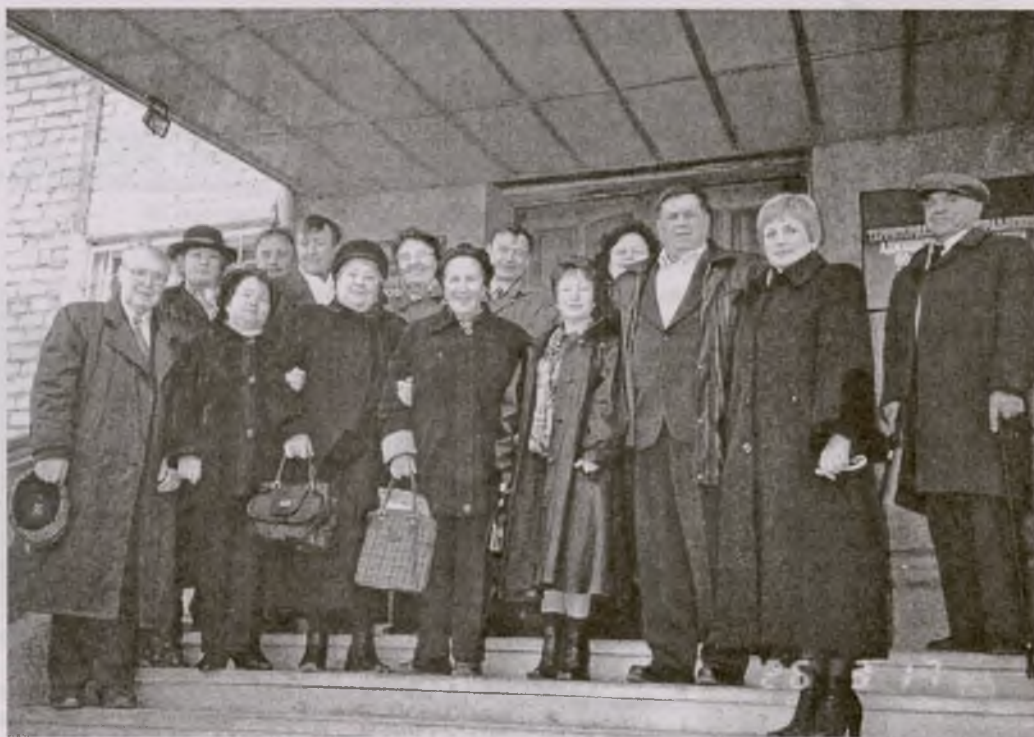
Группа активистов землячества в Тюмени