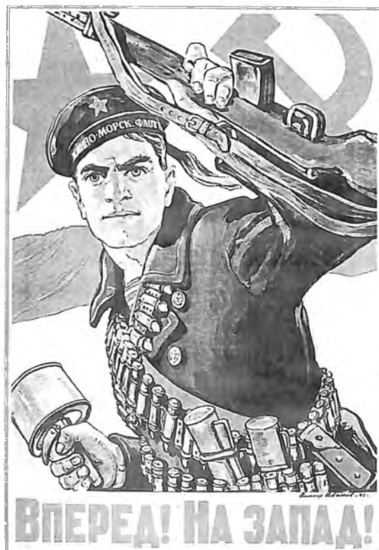
Плакат времён войны