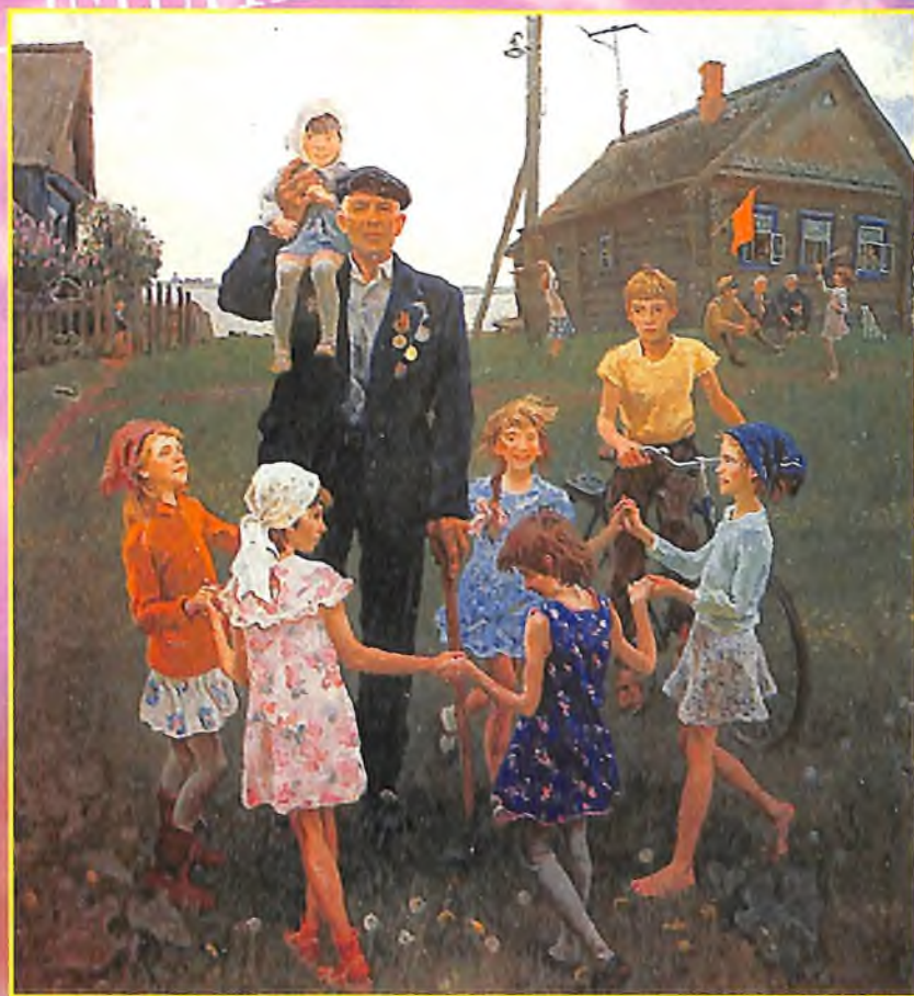
• Ветеран. Художник С.П. Ткачев. 1985 г.