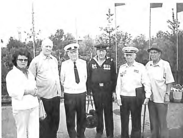
В День ВМФ, 25 июля 2004 г.