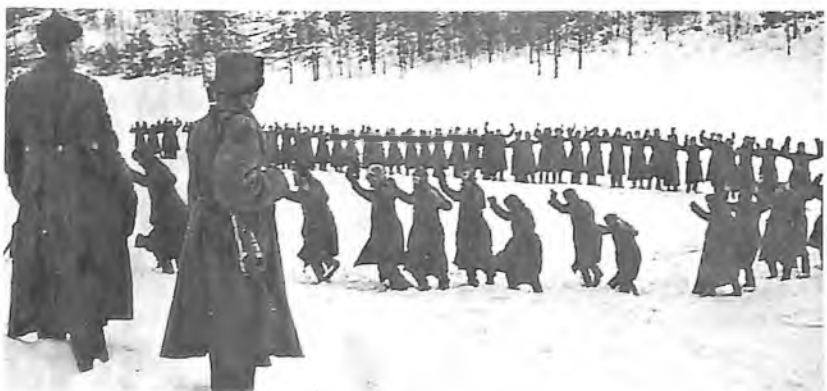
Отвоевались. Подняли вверх руки!