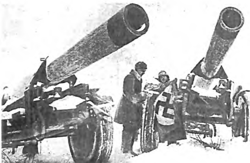
В районе Красной Поляны войска 16-й армии захватили два сверхтяжелых орудия, специально доставленных фашистами для обстрела Кремля