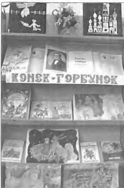
Выставка изданий «Конька-горбунка»