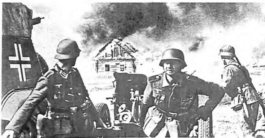
Немецкие солдаты ведут бой под Брестом. 1941 г.