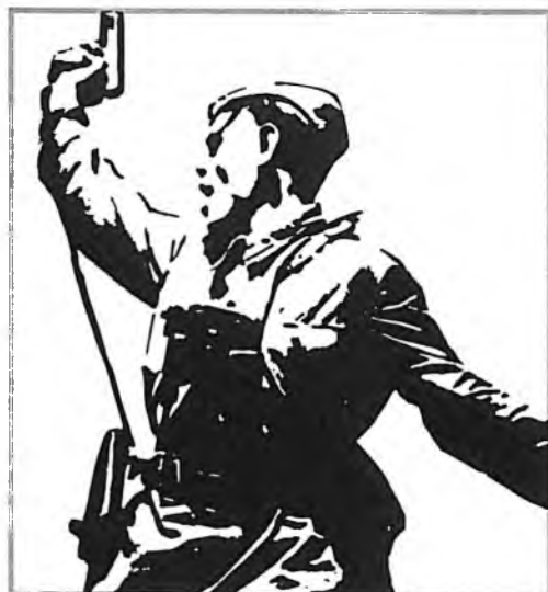
“В атаку !” Комбат Красной Армии