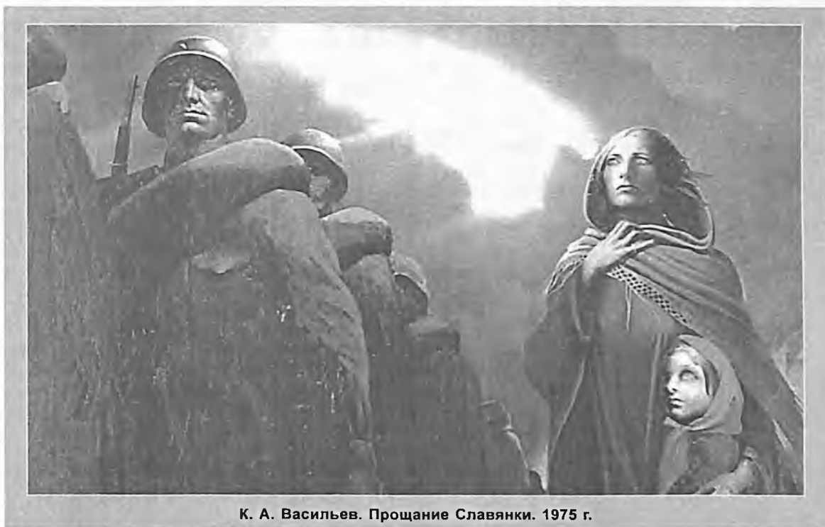
К. А. Васильев. Прощание Славянки. 1975 г.