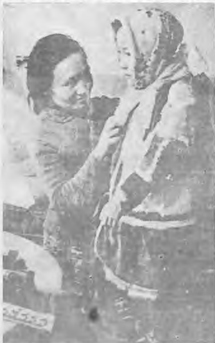
СОБИРАЕМСЯ В ШКОЛУ.

27. Параскева-грязниха. На Грязниху большая грязь осталась четыре седмины до зимы.