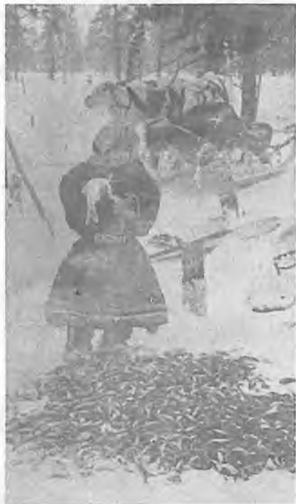
Маленький рыбак.

Из куропачьего мяса тешь, сам будешь смелым. сало не вытопишь.