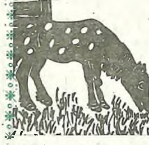
Любит свежую траву.