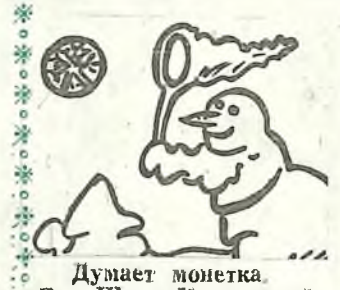
Думает монетка. Рис. Шуры Курочкиной.

Он маня. Теперь уже пенсионер. Но старик крепкий упрямый. Никак не хочет выпускать из рук рычаги бульдозера. Придет на стройку и просит механика: