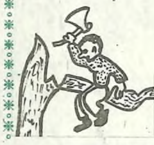
Под собой рубит сук?