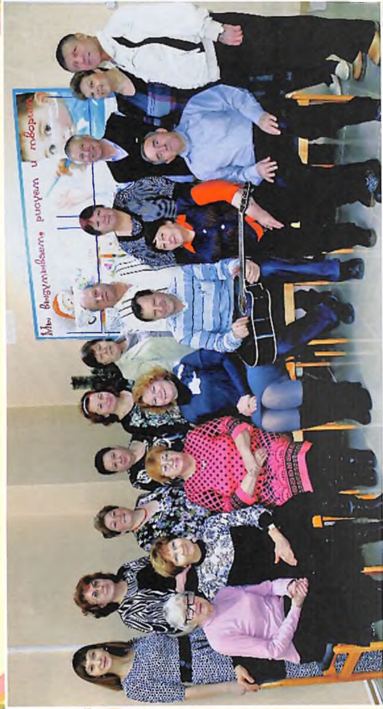
28.01.2018 г., пос. Приобье, Октябрьского район. МКУ «Приобская библиотека семейного чтения». Литературно-музыкальный вечер «Носил он совесть ближе к сердцу...», посвященный 80-летию со дня рождения В. С. Высоцкого. На фотографии писатели и поэты пос. Приобье и гости вечера.