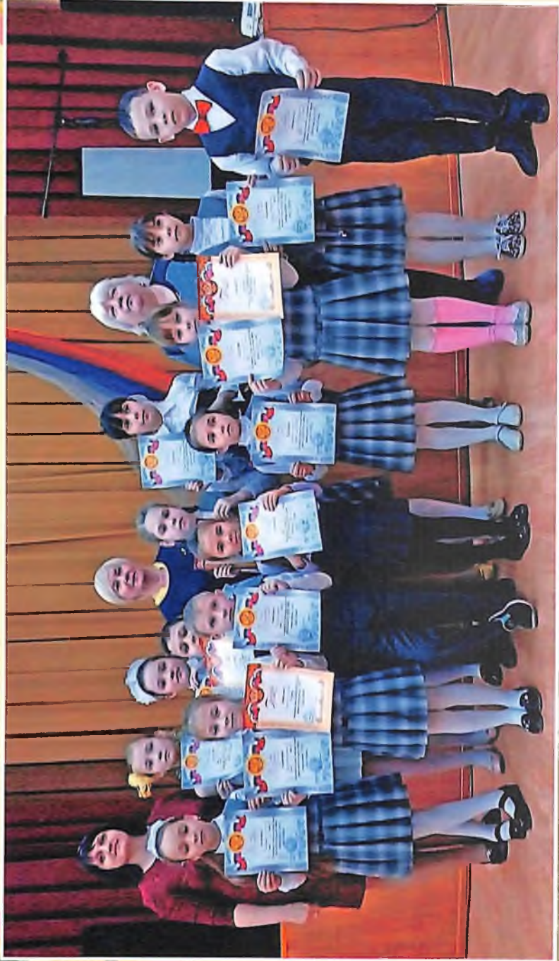
31.01.2018 г., Томень. МАOU СОШ №32. Всероссийский конкурс чтецов прозаических произведений «Живая классика».