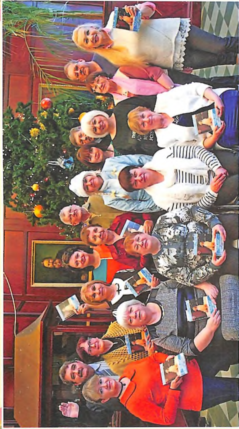
23.12.2017 г., Тюмень. Классическая купеческая усадьба — музей Колокольниковых. В таком необычном месте прошла презентация нашего 23 номера альманаха «Поззия земли Тюменской».